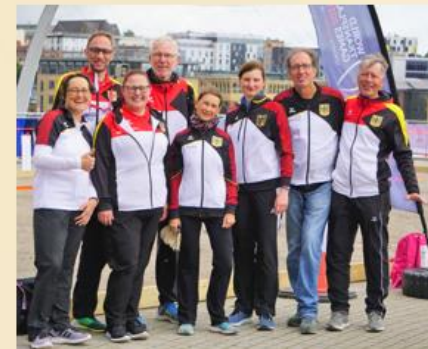
Das Deutsche Pétanque-Team bei den World-Transplant-Games 2019 in Newcastle/England.