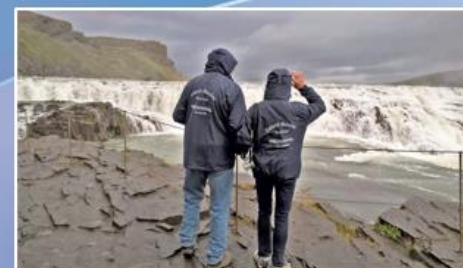
Am Gullfoss-Wasserfall auf Island!