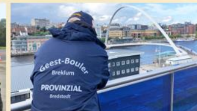
Wolfgang Lorenzen - Geest-Bouler Breklum in Newcastle/England an der Millennium-Bridge